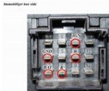
Audi 100, A6, A4, A8