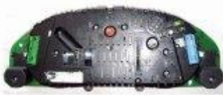
VW B5, Golf IV, New Beetle, Audi A2, A3, A4, A6, TT

GND --- Dashboard Blue connector pin 24 K --- Dashboard Blue connector pin 25 B+ --- Dashboard Green connector pin 1 IGN +12V --- Dashboard Blue connector pin 1